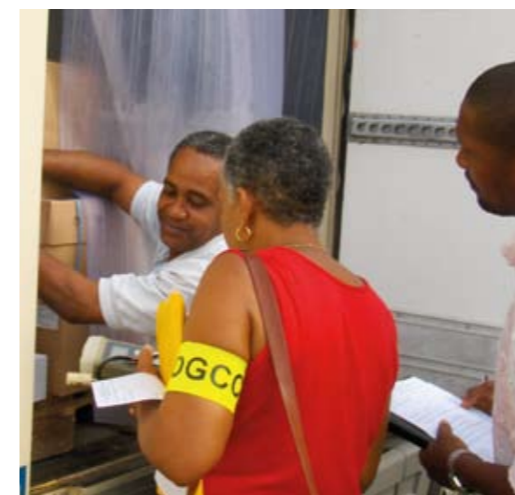
Contrôle routier aux Antilles